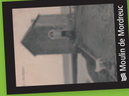
Moulin de Mordrec

• Mordrec, ses gabarres et les souilles de Pleudihen. Près du moulin à marée, vous pourrez voir les souilles où venaient s'échouer les gabarres de Pleudihen. Les souilles de Mordrec étaient des ports empierrés. Elles sont aujourd'hui fermées par une digue. Saint-Malo avait besoin de bois de chauffage, les gabarres, lourdes embarcations aux voiles de toile rousse, le transportaient au gré de la marée et du vent. Le bois venait des forêts du Tronchet, de Coëtquen, de Tanouarn et formait des montagnes de fagots. Les gabarres ont assuré ce transport depuis la fin du XVI e siècle jusqu'à la guerre de 1914-1918 où il a été supplanté par le chemin de fer et chez les boulangers de Saint-Malo par le charbon d'Angleterre. L'existence du moulin à marée de Mordrec est attestée dès le début du 16 e siècle (il est mentionné en 1506).