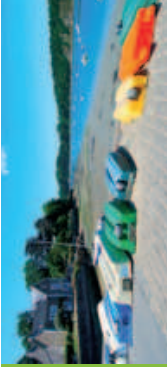
Cale de Mordrec

• Mordrec, ses gabarres et les souilles de Pleudihen. Près du moulin à marée, vous pourrez voir les souilles où venaient s'échouer les gabarres de Pleudihen. Les souilles de Mordrec étaient des ports empierrés. Elles sont aujourd'hui fermées par une digue. Saint-Malo avait besoin de bois de chauffage, les gabarres, lourdes embarcations aux voiles de toile rousse, le transportaient au gré de la marée et du vent. Le bois venait des forêts du Tronchet, de Coëtquen, de Tanouarn et formait des montagnes de fagots. Les gabarres ont assuré ce transport depuis la fin du XVI e siècle jusqu'à la guerre de 1914-1918 où il a été supplanté par le chemin de fer et chez les boulangers de Saint-Malo par le charbon d'Angleterre. L'existence du moulin à marée de Mordrec est attestée dès le début du 16 e siècle (il est mentionné en 1506).