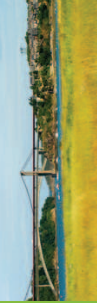
La Ville Ger